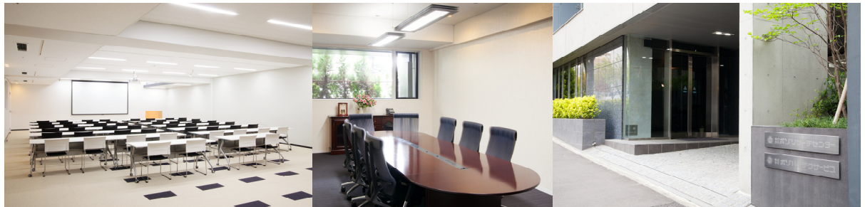
渋谷区大山の本部オフィス風景